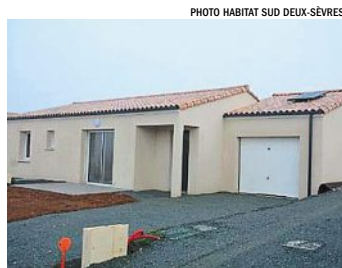
L'un des douze pavillons.

Habitat sud Deux-Sèvres a dévoilé, hier, son opération Vente en l'état futur d'achèvement qui englobe la construction de douze maisons individuelles à basse consommation (T3 et T4) au niveau des rues Caroline Aigle et Georges Treille. « Le Chant des alouettes » est le fruit d'un premier partenariat mis en place entre le bailleur social et le lotisseur et aménageur Villareal. Le montant des travaux se chiffre à 1 674 000 € TTC. Une 2 e opération de quatre logements est d'ores et déjà programmée. Située dans le même lotissement, cette deuxième tranche sera livrée au cours du second semestre 2019.